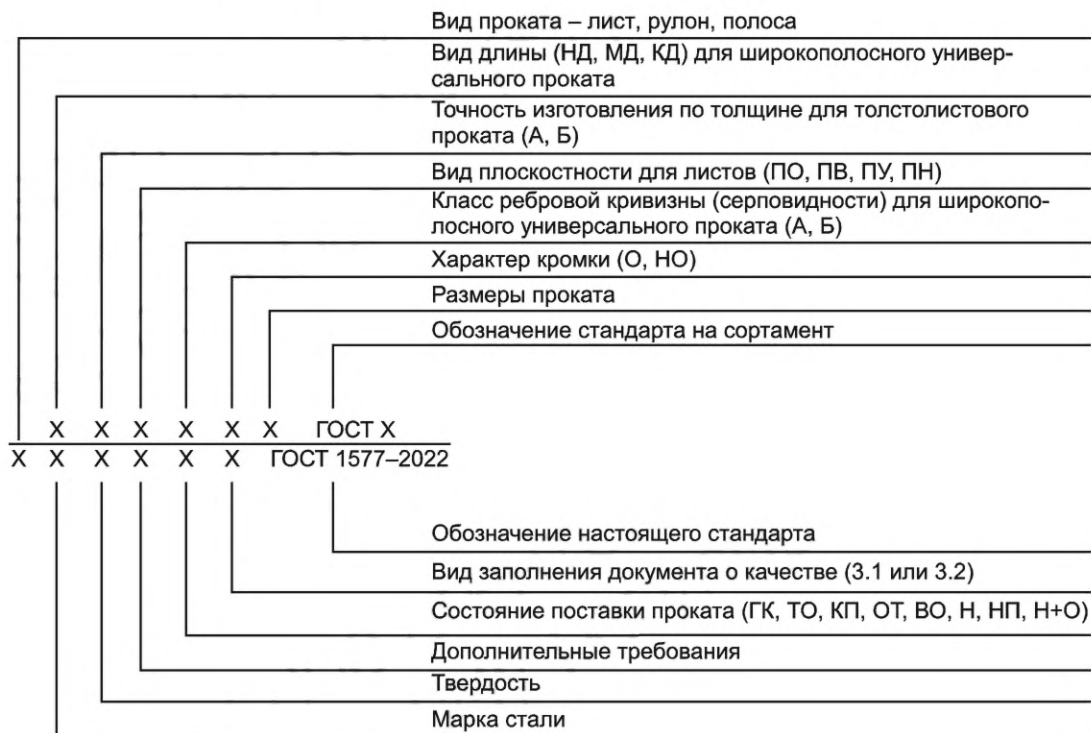
Схема и примеры условных обозначений проката

Примечание — Дополнительные требования указывают в соответствии с 7.3 и 7.4 в виде условных обозначений (например, «КИ», «1С»), при отсутствии условного обозначения — в виде ссылки на соответствующий пункт (например, «с учетом 7.3.1»).